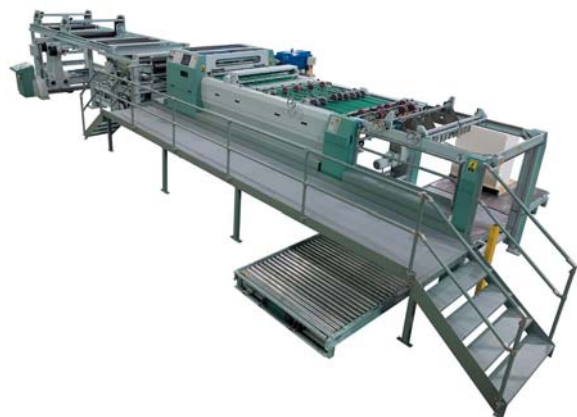
Листорезальная машина больших форматов SHM 1450 DR (с двойным синхронным устройством поперечной резки) эффективно и надежно обрабатывает бумагу, картон, пленки и другие искусственные материалы

штанцевания, подборки и скрепления изделий. Опционально машина может дооснащаться автоматической подачей подобранных блоков и секцией резки по технологии Люмбака (подобранные изделия временно скрепляются клеем для возможности автоматической обработки и после подачи в машину клеевой переплет обрезается до готового формата изделия).